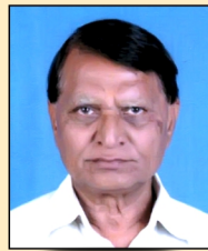
જયંતિભાઈ એ. કા. પટેલ શાખ કમિટી સભ્ય